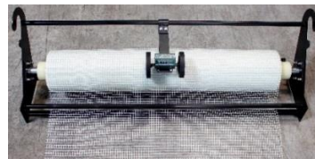
Dérouleur treillis armature fibre verre

- Une seconde épaisseur du même enduit (1,5 kg/m 2 minimum), est posée, frais sur frais ou 24 h plus tard, et finie à la lisseuse ; elle recouvre et protège l'armature.