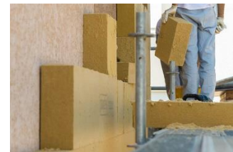
Panneau fibres de bois

- Réalise un calepinage de pose des panneaux d'isolants : calcule la quantité d'éléments nécessaires, avant de faire les coupes