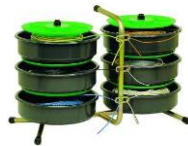
Dérouleurs de fils