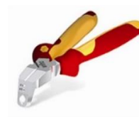
Pince /Couteau dénudage