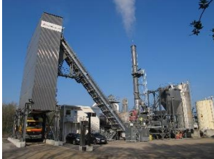
Centrale Fixe continue

Assure l'approvisionnement, le fonctionnement et l'entretien courant d'une centrale fixe ou mobile de fabrication d'enrobés (à froid, à chaud,) ou d'asphalte.