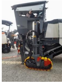
Raboteuse compacte 1m 1m20 1m30à cabine fermée

L'utilisation si possible de cabines fermées (voire pressurisées avec filtre) est fortement préconisée , les machines étant manœuvrées intégralement depuis la cabine, et équipées de brumisateurs , afin de rabattre au sol les éventuelles fibres d'amiante ou de silice en suspension.