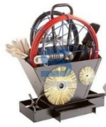
Porte outils ramonage