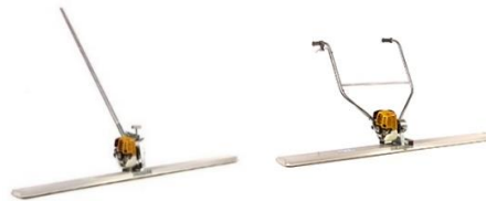
Règles vibrantes mécaniques

Peut utiliser une machine (moteur diesel) 2000 m2 dallage/j, équipée d'un rouleau pour régler le niveau du béton et d'une règle vibrante guidée par 2 lasers positionnés à chaque extrémité de la règle