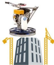
Mosquito ( mini talocheuse)