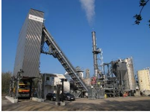
Centrale Fixe continue

Assure l'approvisionnement, le fonctionnement et l'entretien courant d'une centrale fixe ou mobile de fabrication d'enrobés (à froid, à chaud,) ou d'asphalte.