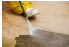
Jet Haute Pression