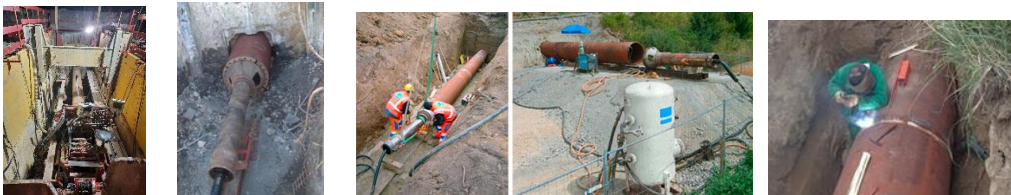
Marteau pousse tube par battage

- Fixe une fusée pneumatique pousse-tube à l'arrière du tuyau au moyen de sangles, des collets assurant le contact entre la fusée et le tuyau ; le diamètre intérieur de ces collets correspond à celui de la fusée et leur diamètre extérieur à celui de la canalisation ; la fusée alimentée par un compresseur de forte capacité frappe le tube et provoque sa progression dans le sol par battage