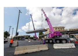
Grue mobile sur porteur, ou automotrice de chantier à flèche télescopique :