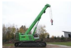
Grue mobile sur chenilles à flèche télescopique :

PREVENTION GAGNANTE BTP Performance Economique