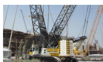
Grues mobiles sur chenilles à flèche treillis