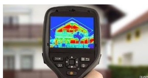
Appareil Diagnostic thermique