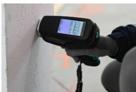
Appareil Fluorescence X