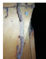
Cordonnets termites en activité