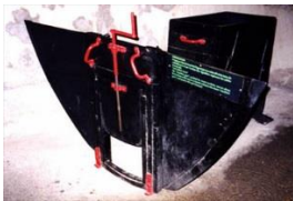
Mitrailleuse curage égout

- Evacue les sables et les boues encombrant le fond des collecteurs, à la pelle, à la raclette, à la brouette (brouette mécanique) ou à la "mitrailleuse" (sorte de charrue hydrodynamique) ;