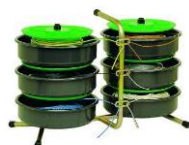
Dériveurs de fils