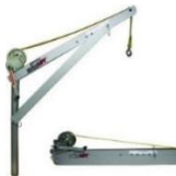
Grue montée sur acrotère

En utilisant des aides à la manutention : monte-matériaux, grue de terrasse électrique ou thermique, réglable en hauteur (permettant de passer au-dessus des garde-corps, sans les retirer) ; grue Spitz Lift montée sur un support acrotère ; panier métallique équipé de points de levage pour hisser les bouteilles, outil d'aide aux déplacements des rouleaux ; (les escaliers ou l'échelle, la manutention manuelle sont encore trop souvent utilisés...).