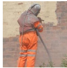
Sablage à Sec