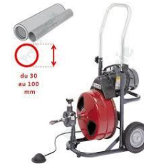
Pompe à détartrer