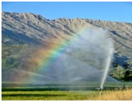
Canon brumisation eau