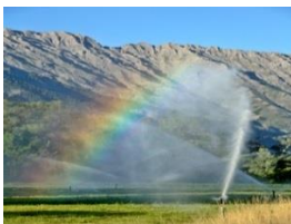
Canon brumisation eau

- Les engins utilisés pour le terrassement en terres amiantées, doivent permettre un travail sous arrosage (réseau d'aspersion fixe au plus près de la zone de travail) ou :