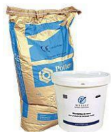
Sac /seau billes

Utilise de préférence un engin de marquage des routes équipé d'un dispositif de contrôle permanent, du dosage des microbilles de verre , afin d'obtenir une bonne qualité et un moindre gaspillage ( 60% de gaspillage de microbilles sur les engins non équipés)