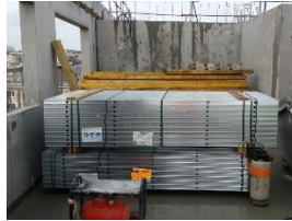
Approvisionnement plaquiste dans les niveaux.

Peut réaliser l'approvisionnement de certains matériaux, (rails, montants , plaques de plâtre), dès la phase de gros œuvre , afin de réduire les manutentions manuelles, réalisées par l'extérieur, après le gros œuvre.