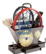
Porte outils ramonage